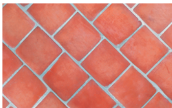
055 Sevilla New