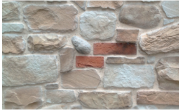
774 Mix Toscana